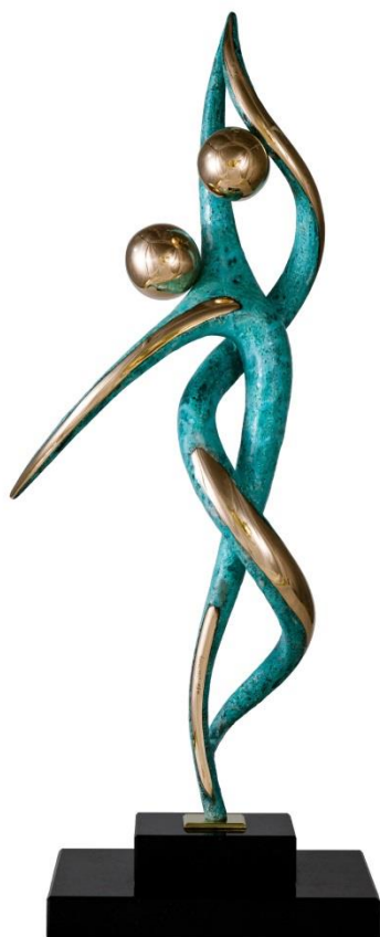
« Tendresse » Bronze patiné